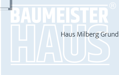
Haus Milberg Grundriss OG