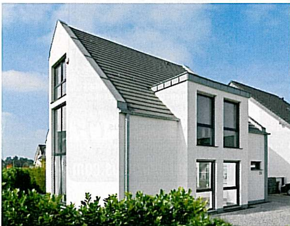
Große Fenster rund ums Haus holen viel Tageslicht ins Innere und geben dem Äußeren ein freundliches Antlitz.

Ein Haus, das seinesgleichen sucht: einfach in den Formen und extravagant in der Zusammenstellung der verschiedenen architektonischen Elemente. Der rechteckige Baukörper mit dem Satteldach ohne Überstand wird an den Traufseiten jeweils von einem zweigeschossigen Flachdacherker durchbrochen. Ein weiterer Rücksprung an einer Giebelseite